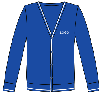
Toote kood: VALO 02 Laste kardigan poistele ja tüdrukutele Suurused: 116-164 Materjal: 50% peen meriino vill, 50% polüakrüül Hind: 34,00 EUR