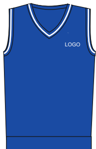
Toote kood: VIO 01 Laste vest poistele ja tüdrukutele Suurused: 116-164 Materjal: 50% peen meriino vill, 50% polüakrüül Hind: 28,00 EUR