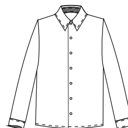
Poiste triiksärk KEVIN Värvus: valge, hallid detailid Suurused: 116-170 Materjal: 55% puuvill, 45% polüester Hind: 29,60 EUR