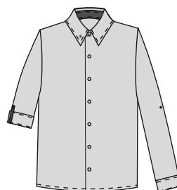
Poiste triiksärk KEVIN Värvus: halahall tumehallid detailid Suurused: 116-170 Materjal: 55% puuvill, 45% polüester Hind: 29,60 EUR