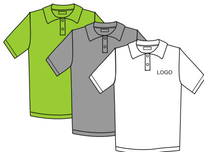
Laste polosärk lühikeste varrukatega JN070K Värvused: lime, white, rose Suurused: 110-116, 122-128, 134-140, 146-152, 158-164 Materjal: 100% puuvill Hind: 12,00 EUR