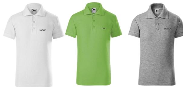
Laste kitsalõikeline polosärk 222 Värv: white, apple-green, grey-heather Suurused: 6 aasta / 122, 8 aasta / 134, 10 aasta / 146, 12 aasta / 158. Materjal: 65% puuvill / 35% polüester, 200 g/m2 Hind: 12,00 EUR